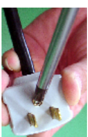
1. コンセントプラグのネジを外し コンセントプラグを2つに分離して下さい。